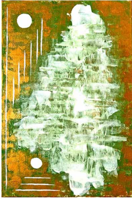
"Purezza ed equilibrio"