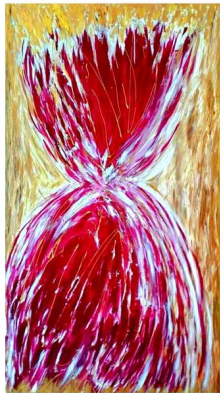
"Miscela di energia"

- astratto - acrilico, spatolato. - cm 100x175.