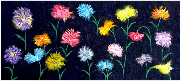
"Fiori nella notte" - acrilico su tela di jeans - cm 53x118.