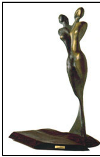
scultura in bronzo