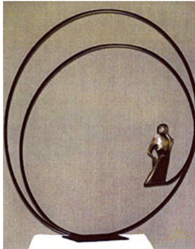
scultura in bronzo