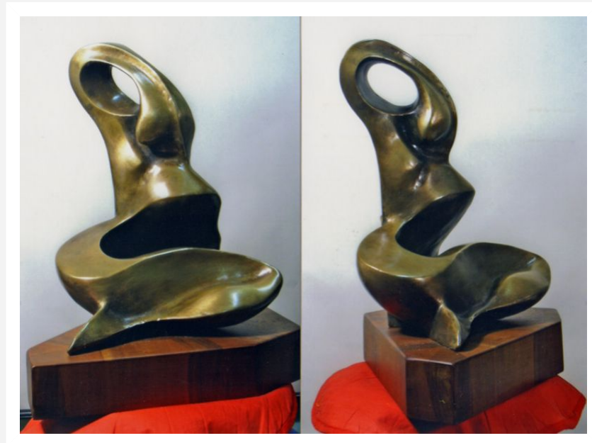
"Risveglio" - 1989 - bronzo con base di legno - cm 23x28