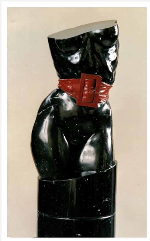
"Cintura" - 1980 - marmo nero e rosso laguna - cm. 165x30