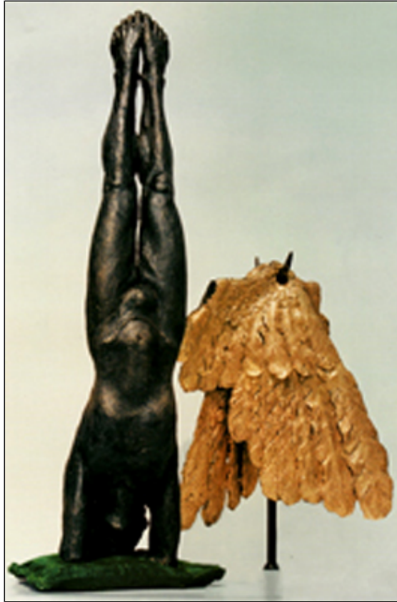
Bronzo patinato e dorato - cm 48x60

“... Le figure di Rodella sono 'sul limite di sempre'. Quello è il loro tempo. Quindi questa è la differenza dal concetto classico della bellezza, distante e distaccato dal dramma. La differenza giace nell'esplosione di dramma che le divide e le fracassa, facendole divenire umane.