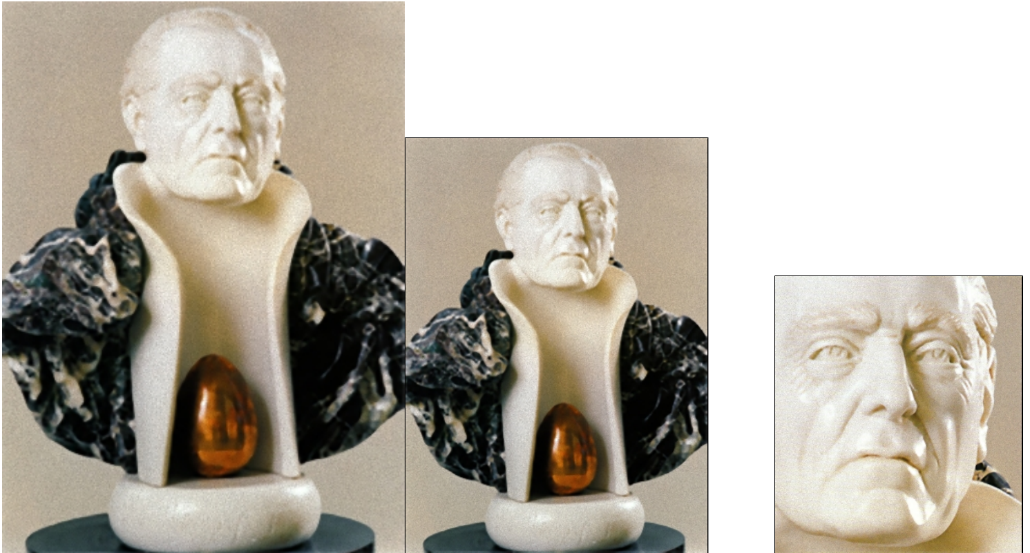
Marmo bianco, rosso Levanto, bronzo - cm 55x65x30