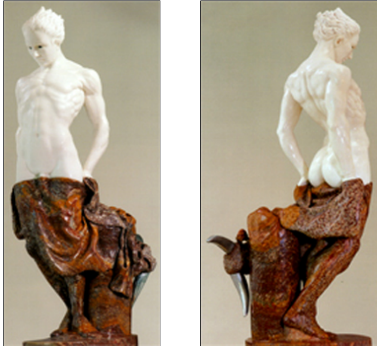
Marmo bianco, onice rosso - cm 150x80

"Le sue prime opere si caratterizzano per l'essenzialità figurativa, per la ricerca di un linguaggio formale che nulla toglie al valore espressivo della scultura.