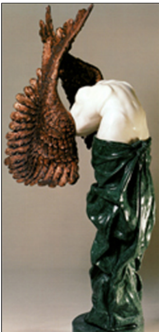
Marmo bianco Carrara, verde Guatemala, bronzo - cm 220x40x80