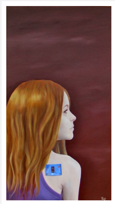
"Senza Titolo" - 2009 - olio su tavola - cm 45x85