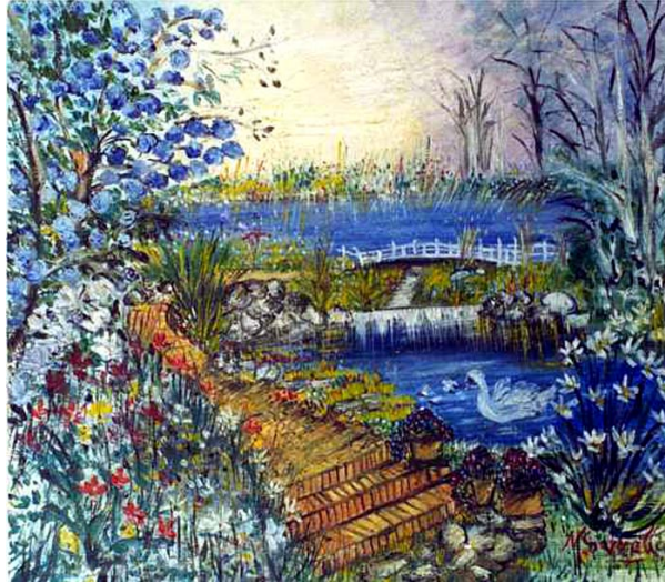
olio su tela - cm 50x60

Monia Sarnella pittrice figurativa riconoscibile principalmente per i suoi paesaggi ricchi di fascino e dalle caratteristiche fiabesche, le sue opere riscuotono successo ed apprezzamenti di pubblico nell'occasione di mostre personali e collettive in Italia.