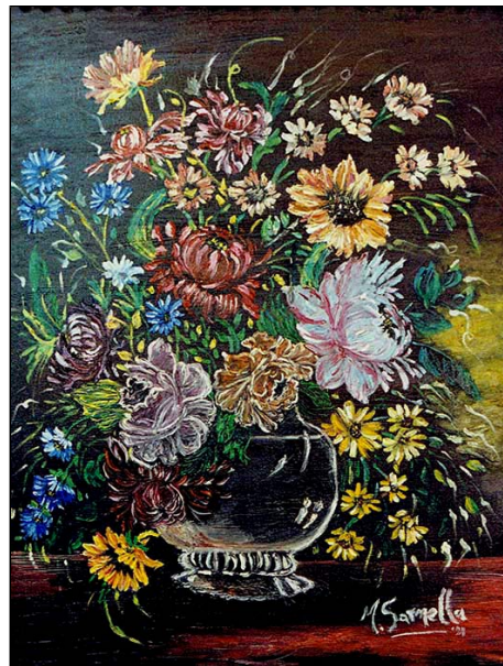
acrilico su tela - cm 70x50

Tutte le opere dell'artista Monia Sarnella catalogate nel nostro Archivio sono disponibili.