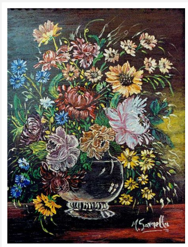
"Vaso con fiori" - 2013 - acrilico su tela - cm 70x50