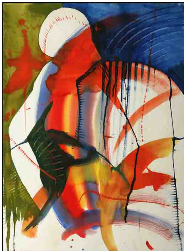
acquerello su carta - cm 55x76

“Città in liquefazione, visioni oniriche in cui tracce e dissolte sagome di elementi umani si confondono nel gioco informale dell'esplosione del colore: tutto questo ed altro, negli acquerelli di Scara. Se non è il “corpo” a dissolversi nel colore è il colore a creare un corpo: un mondo nell'intersezione di gesti istintivi e sagome infuocate. Questo stesso discorso vale anche per città e paesaggi che rivelano atmosfere quasi post-atomiche che lasciano però ancora vibrare la magia della luce, della forma, dei volumi.”