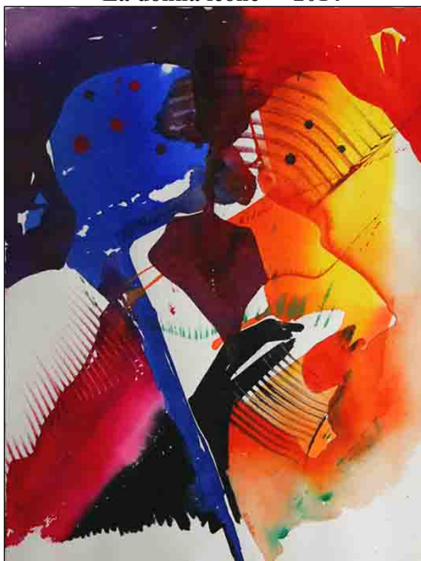
acquerello su carta - cm 55x76

Una dimensione ricca del colore che rimanda ad un pentagramma cromatico dove è assente la definizione rigida nelle singole macchie di colore. E' quasi una vibrazione musicale quella che si legge in ogni singolo manufatto ed è la stessa vibrazione che si espande correlando tra di loro le opere, come in una partitura ricca di passaggi sonori. Nei lavori di Scara ogni sagoma è definita ma nel contempo si liquefa rinvigorendosi, ma anche arricchendo il tessuto cromatico dello sfondo. Ogni singolo colore è in relazione come e non oltre il pentagramma comanda.