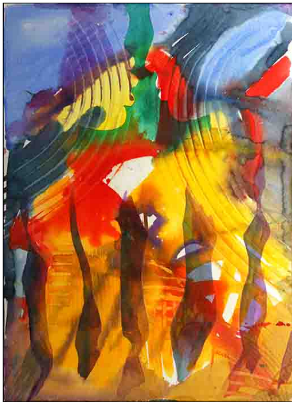
acquerello su carta - cm 55x76