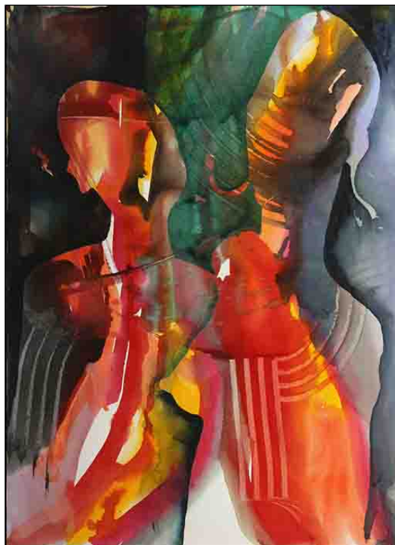
acquerello su carta - cm 55x76

“Quando l'arte si fa storia dell'uomo e delle sue aspirazioni è in gioco la più alta forma di creatività. Si tratta di saper cogliere nella tecnica dell'espressione artistica lo specchio dei sentimenti più profondi e delle affettività più nascoste. Questo artista sembra voler percorrere questa strada: vuole scoprire non la sua identità, ma come sia possibile esprimere il proprio mondo interiore e le proprie idealità attraverso l'arte, attraverso un linguaggio che, inevitabilmente, per queste tematiche si fa metafora.