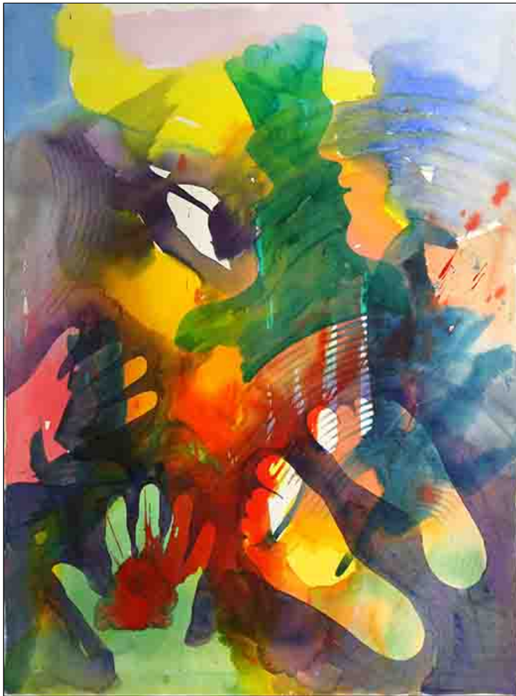
acquerello su carta - cm 55x76