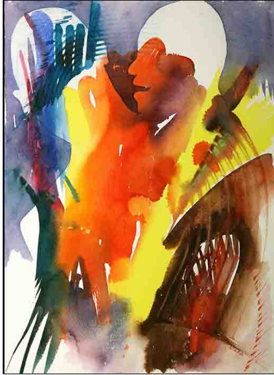
acquerello su carta - cm 55x76