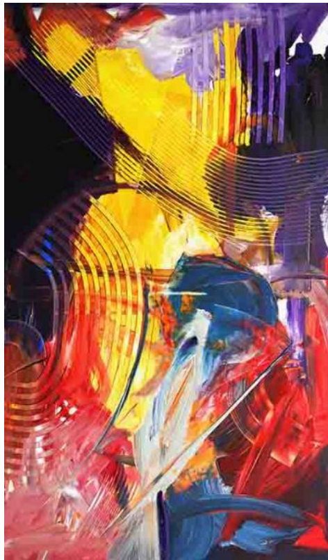
"Ritmo" - 2015 - acquarello su carta - cm 60x100