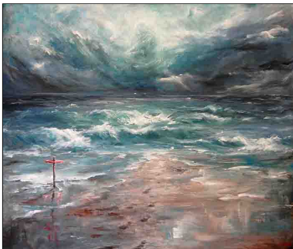
acrilico su tela - cm 120x100

Guarda il video delle opere di Licia Battarra su youtube..