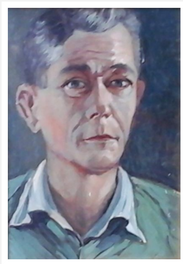
"Autoritratto" - 1945 - olio su cartone - cm 34x24