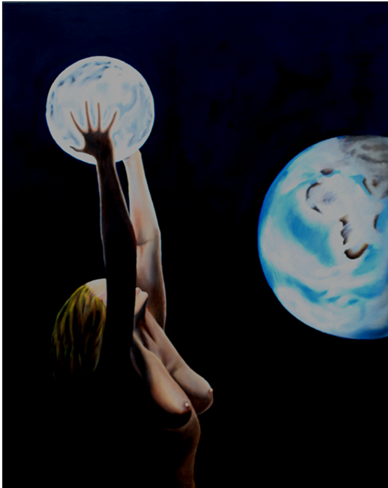
olio e acrilico su legno - cm 68x52 - pezzo unico.