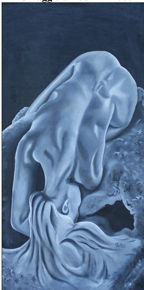
olio su legno - cm 97x50 - pezzo unico.