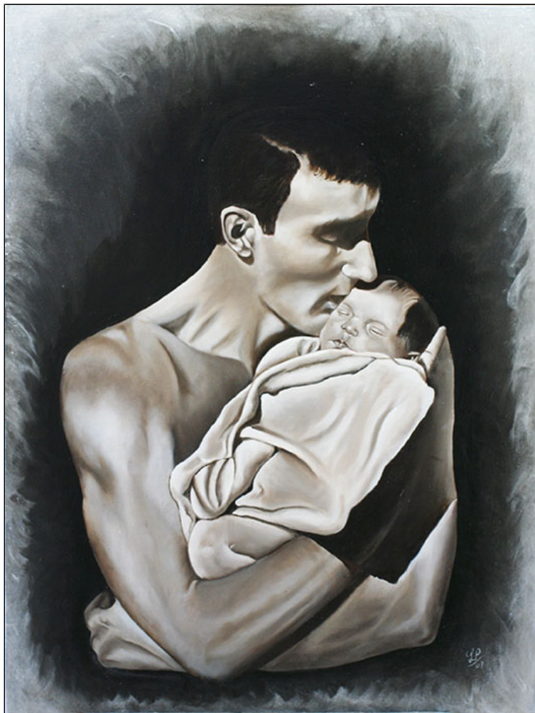
olio e acrilico su legno - cm 68x52 - pezzo unico.