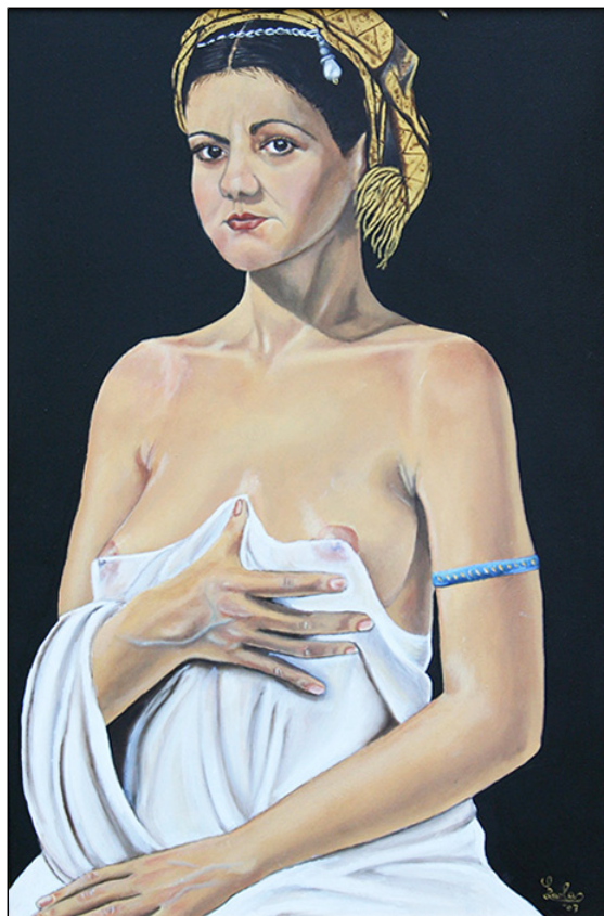
olio su tela - cm 40x60 - pezzo unico.