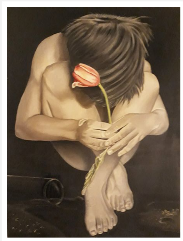
"Tulipano" - 2013 - olio su tela - cm 60x80