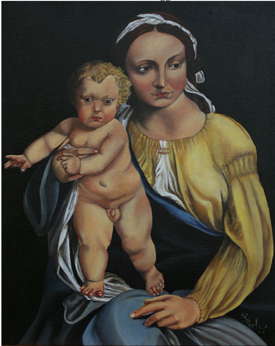
particolare preso dalla fuga in Egitto olio su tela - cm 40x50 - pezzo unico.