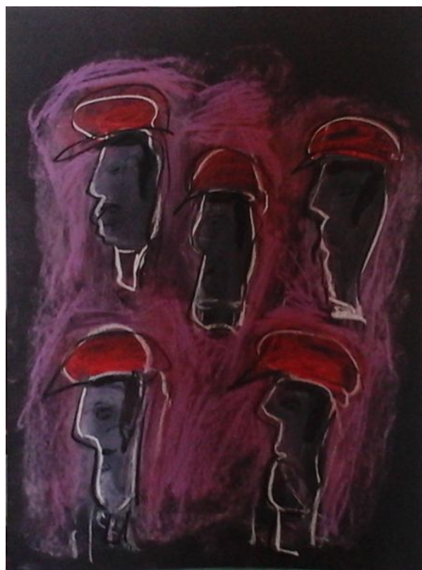
"Cappelli rossi" - 2021 - mista su carta - cm 50x70