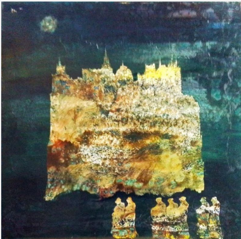
"Viaggio notturno" - - mista su tela -