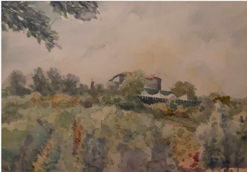
"Il castello di Gorizia" - 2009 - acquarello - cm 50x35,5