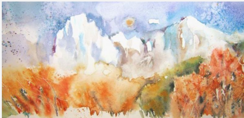
"Sassopiatto Sassolungo" - 2010 - acquerello su carta - cm 57x21