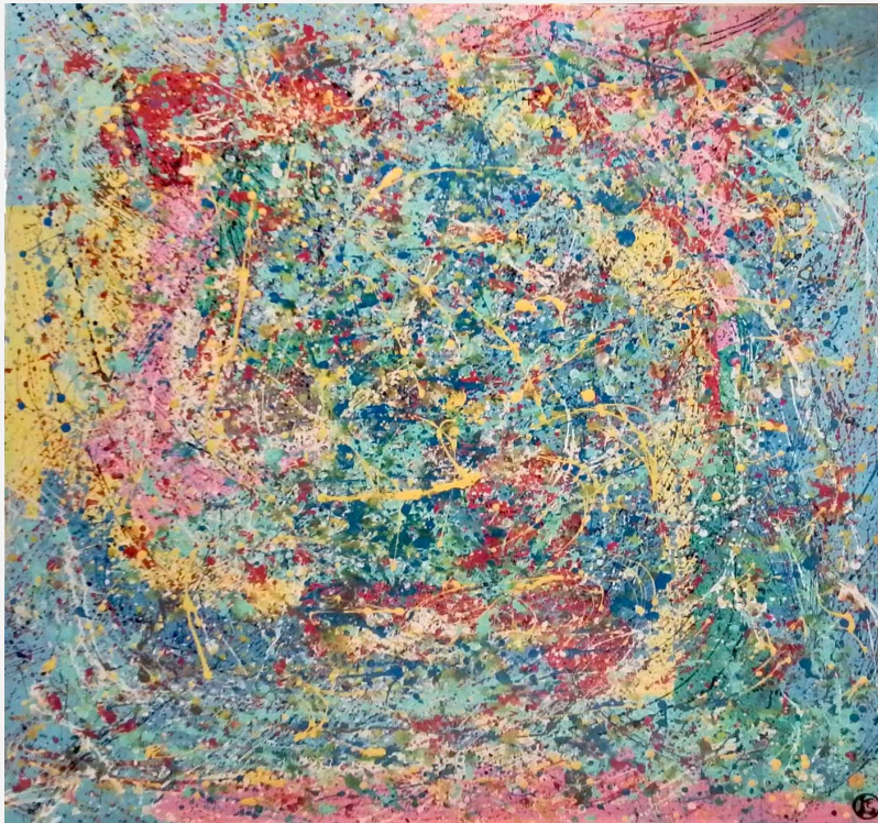
"Fantasie colorate" - 2018 - mista - cm 113x113